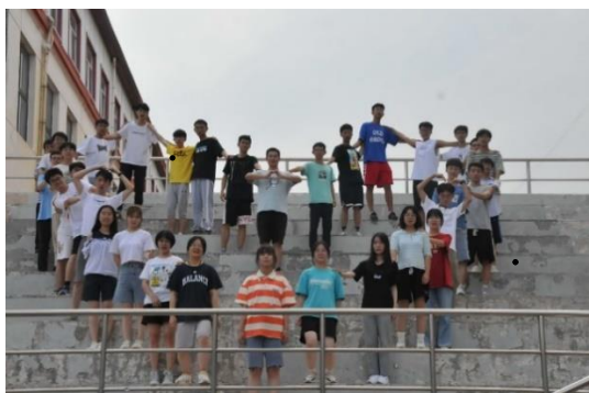
图片 2 21级培训生的集体照

时光太短暂，留下了我的眷恋，刻下了你的自信和天然。时间转瞬即逝，转眼过去三十多天了，暑期培训也迎来尾声。闭上眼，过往的每一天都能清晰地浮现在眼前，一切都仿佛是昨日。